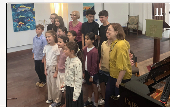
1 Gottesdienst zum Sommeranfang (Junger Chor und Kinderchor) * 2 Jubiläumskonfirmand/innen * 3 Regenbogen-gottesdienst * 4 Gottesdienst zum Schuljahresende * 5 Frauenkreis im Juni * 6 Ausklang des Sommeranfangsgottesdienstes * 7 Der Frauenkreis in den Abruzzen * 8 Piano City * 9 Gemeinde in Bewegung * 10 Interreligiöse Trauung * 11 Passeggiata Musicale 1 Culto di inizio estate (coro giovanile e coro dei bambini) * 2 Confermandi che festeggiano il loro anniversario * 3 Culto Arcobaleno * 4 Culto di fine anno scolastico * 5 Incontro delle donne a giugno * 6 Conclusione del culto di inizio estate * 7 Il viaggio delle donne in Abruzzo * 8 Piano City * 9 Comunità in movimento * 10 Matrimonio interreligioso * 11 Passeggiata Musicale