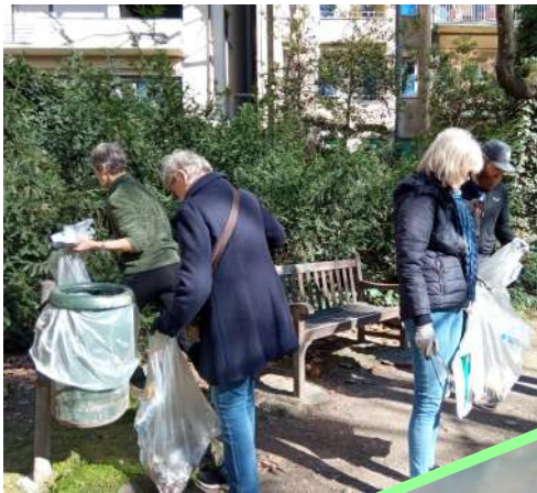
Foto dall'evento organizzato dal Gruppo Ambiente CCPM